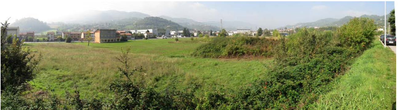
FOTO PANORAMICA n. 2