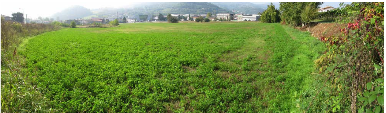
FOTO PANORAMICA n. 4