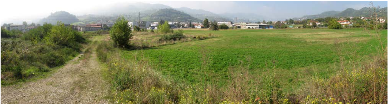
FOTO PANORAMICA n. 3