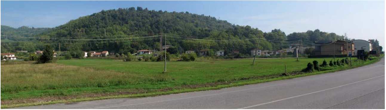
FOTO PANORAMICA n. 1